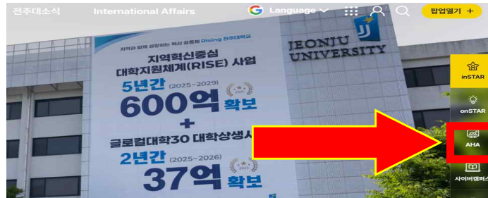
1. 전주대학교 홈페이지 - 우측 AHA 바로가기 클릭