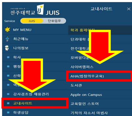
3. JUIS 교내사이트 - AHA(법정의무교육)