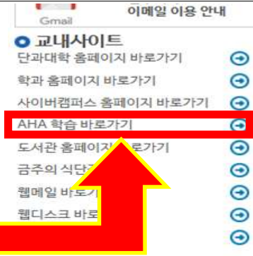
2-2. inSTAR 교내사이트 - AHA 학습 바로가기