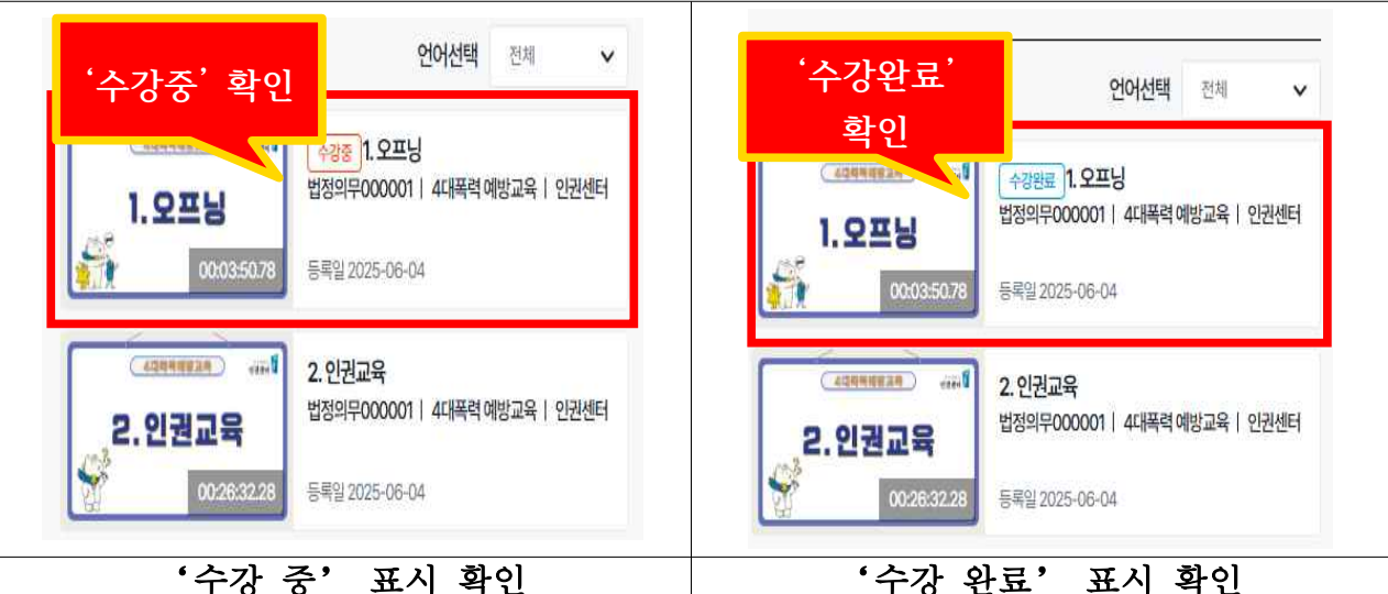
‘수강 중’ 표시 확인