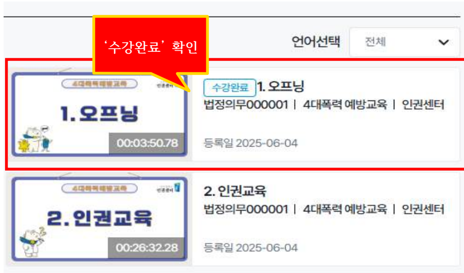
‘수강 완료’ 표시 확인