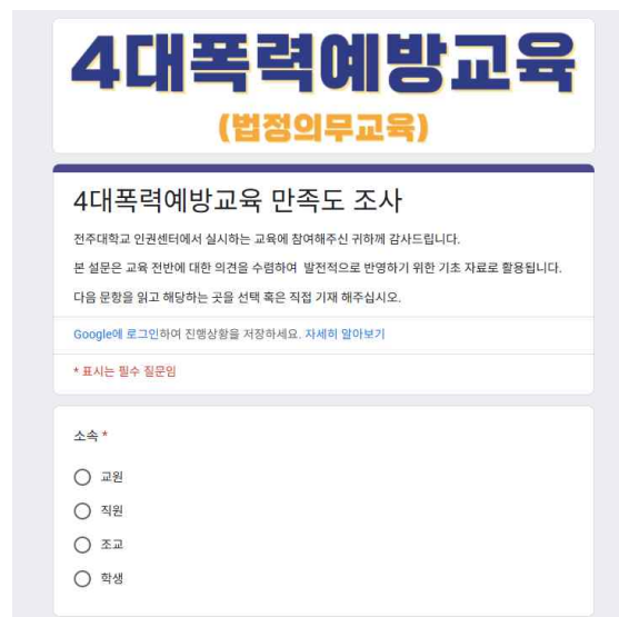
‘4대폭력예방교육 만족도 조사’ 응답