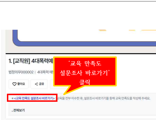
영상 하단의 ‘교육 만족도 설문조사 바로가기’ 접속